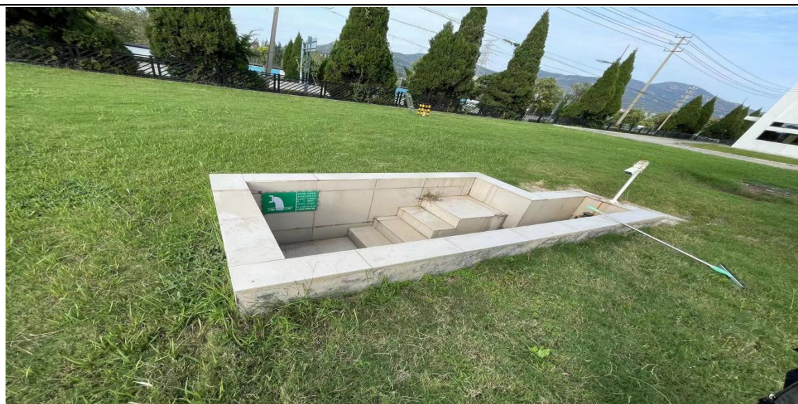
图 5-2 厂区污水总排口

本项目废水主要为软水处理废水及蒸汽发生器排水。废水经厂区污水处理厂处理后达接管标准后进入墟沟污水处理厂深度处理。本次验收监测废水共设置 1 个监测点：污水处理站出口。详见检测点位图 10-1。