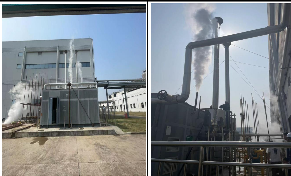
图 5-1 蒸汽发生器现场图片

本次验收监测有组织废气共设置 2 个监测点 (□1-□2) 分别为 1#蒸汽发生器废气排气筒出口；2#蒸汽发生器废气排气筒出口。详见检测点位图 10-1。