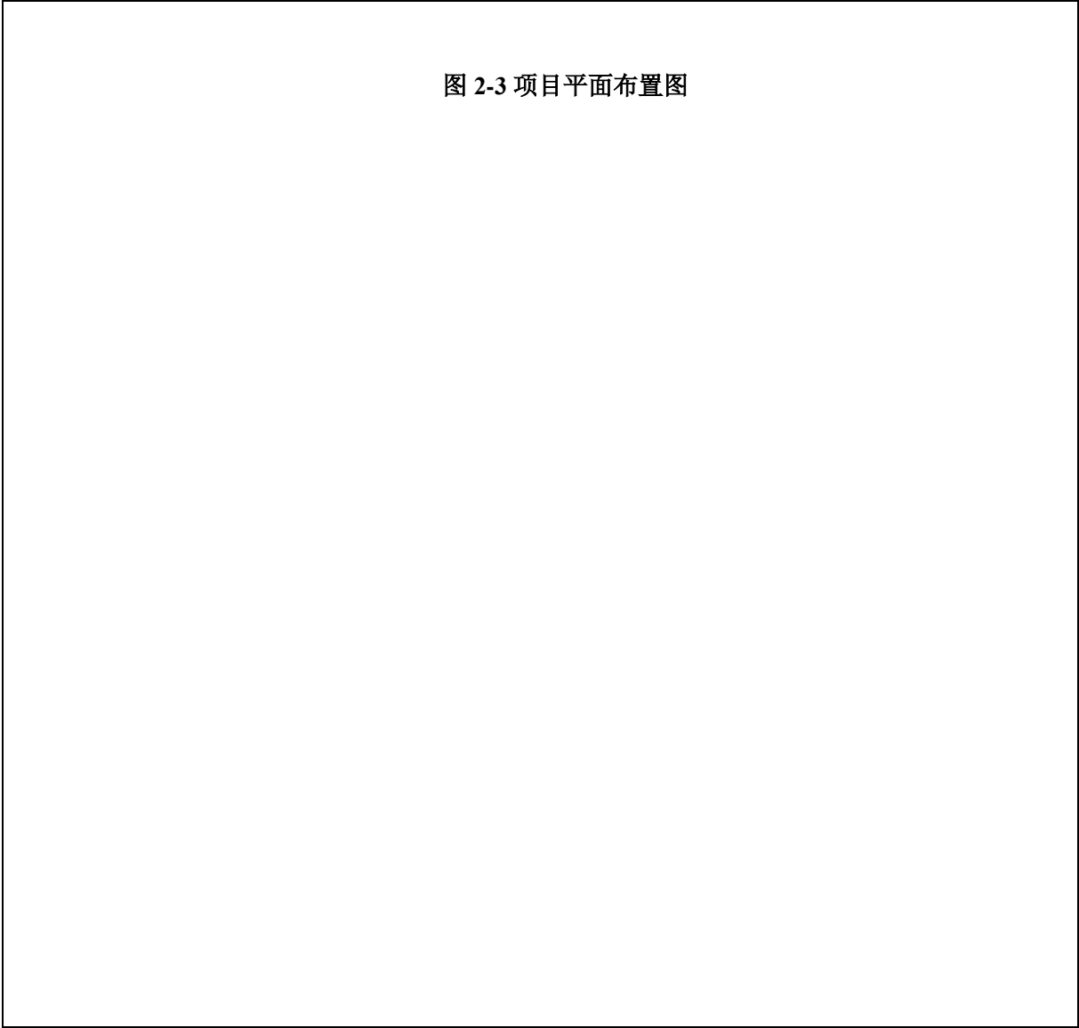
图 2-3 项目平面布置图