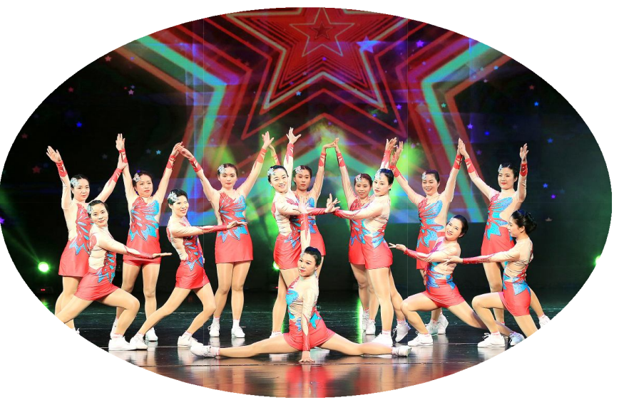
晚会在欢乐的工间操《让世界听我的》中开启，这支由公司工会选送的节目，曾摘获绍兴市首届职工工间操比赛两个金奖。

回首2017年，面对激烈的市场竞争、成本的不断攀升，公司全体员工上下一心，迎难而上，积极有为：以质量为本，内抓管理，外拓市场，匠心酿造美酒，讲好黄酒故事，积极实施黄酒+互联网、黄酒+旅游、黄酒+文化等战略，在创新发展中拓展黄酒新空间，取得良好的经济效益与品牌效益。2017年黄酒集团业绩创历史新高，2018年1月实现营业收入5.26亿元，与上年同比增长14%；实现利润4723万元，同比增长17%，实现“开门红”。古越龙山蝉联亚洲品牌500强、以166.35亿元的品牌价值蝉联第十一届中国品牌价值500排行榜第263位，成为唯一入选黄酒品牌。蝉联第四届世界互联网大会指定接待用酒，在重要国际舞台一展风采…… 2017，我们共同走过，努力付出，收获满满；2018，新时期、新目标、新作为，我们扬帆起航再出发。