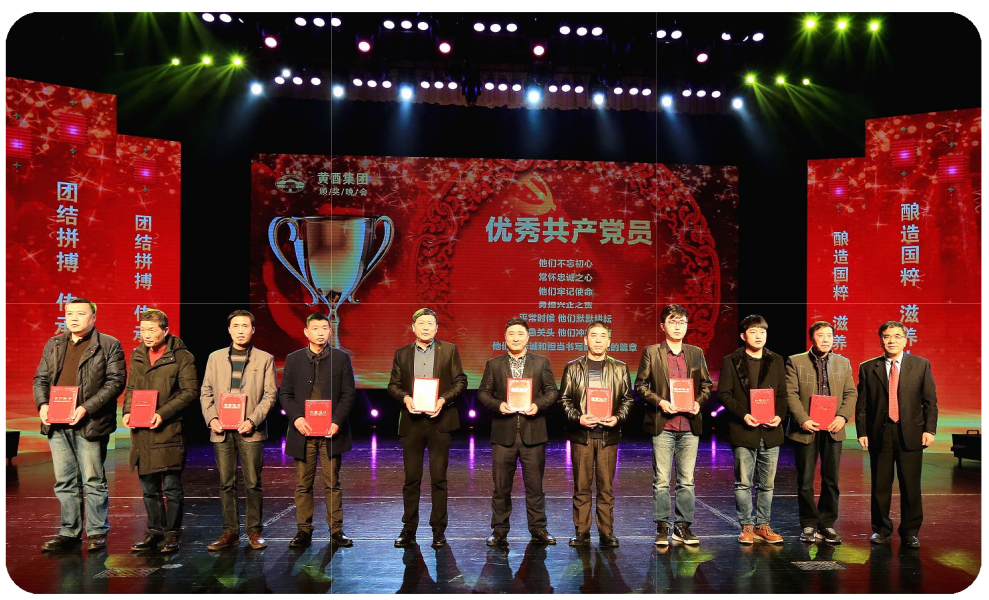
颁奖盛典上，15个先进集体、157个先进个人受到表彰。鲜花与掌声献给黄酒集团最可爱的人。