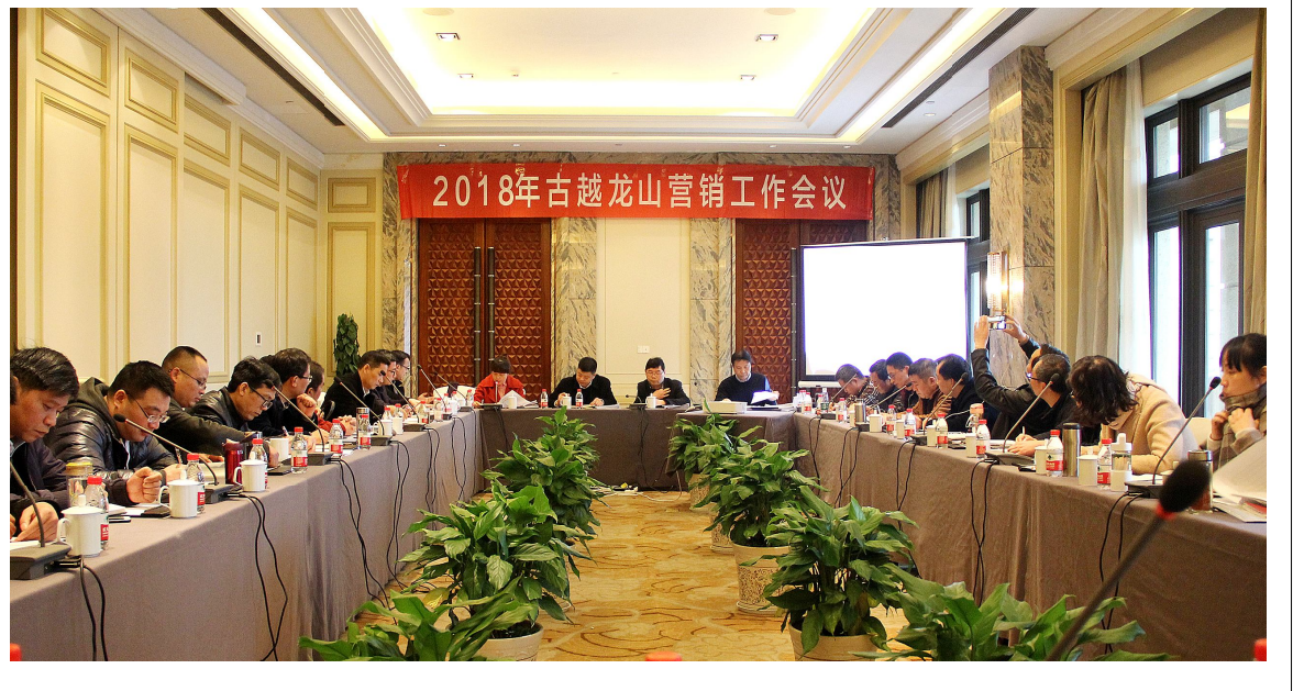
2018年古越龙山营销工作会议

会上，围绕毛利率、净利率、费用率等考核指标，柏总详细解读了公司考核激励的政策导向，并指出销售费用、人员配备、产品开发、物流仓储、营销推广、市场管理、考核机制和营销培训等都必须系统跟上，特别是产品开发方面，关键要做好老产品提升和中高档差异化新产品开发工作，对照供给侧结构性改革要求“去产能、去库存、去杠杆，降成本、补短板，存量优化、增量优质”。面对新消费形势，我们要做好诚信年份酒工作，“存量优化、增量优质”就可突破，再通过营销策划品牌宣传，结合互联网工具，让中央酒库存酒成为古越龙山的核心资源，巩固行业老大地位。（茹拥政/办公室）