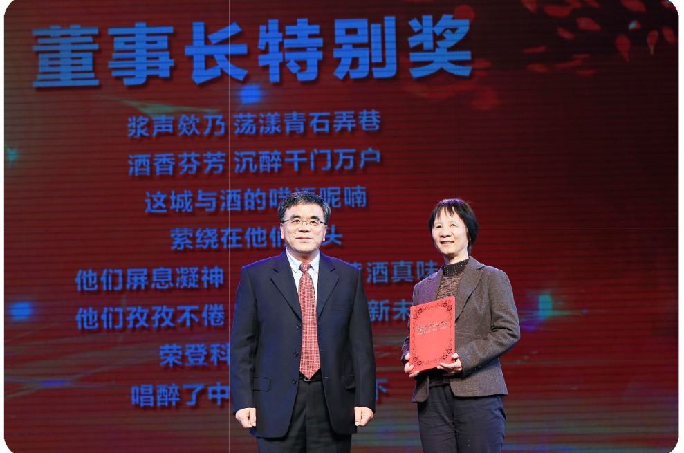
科技彰显工匠精神。今年的董事长特别奖授予我们的科研团队——在他们的共同努力下，“黄酒绿色酿造关键技术与智能化装备的创制及应用”获2017年国家技术发明奖二等奖，成为黄酒行业获得的首个国家科技奖；“优质高效安全绍兴黄酒酿造酵母选育及产业化应用”获2017年浙江省科学技术进步二等奖。