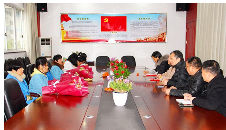
“三·八”国际妇女节当天，古越龙山酒厂党总支开展党员主题活动，座谈慰问四名困难女职工，了解生活情况，送上节日的祝福。