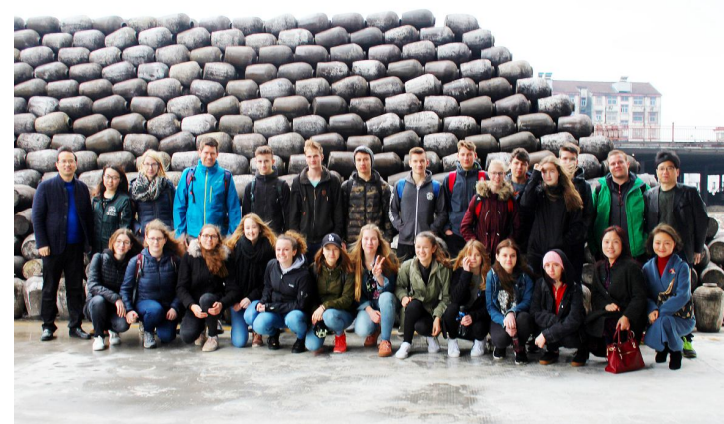
3月16日，上虞春晖中学德国交流生一行20余人参观女儿红公司，亲身感受绍兴女儿红黄酒的独特魅力与深厚的文化底蕴。这些德国友人将女儿红黄酒赞不绝口，表示要将女儿红黄酒、女儿红文化带回，分享给更多的人。（张宇超/女儿红公司）

本次表彰会既是一次总结会、表彰会，更是一次动员会、鼓劲会，通过表彰先进，树立典型，进一步调动广大职工的积极性，同时每一位受表彰的先进集体和先进个人都应该珍惜荣誉、戒骄戒躁，继续发挥先进模范作用。春场酿造还在如火如荼的进行，瓶酒生产依然加班加点，我们仍将咬紧牙关、严守岗位，争取大冬酿工作的完美收官。（俞建明/沈永和酒厂）