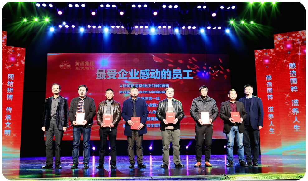
今年还评出“最受企业感动的员工”——生产旺季，加班加点奋战在一线的员工。大会给予的颁奖词是——火热的车间，有他们忙碌的背影；激烈的市场，有他们冲刺的身影；他们奋战在一线，不辞劳苦、舍小家顾大家，演绎了无数感人的故事。他们以忠诚托起黄酒梦想，他们用奉献谱写生动乐章。